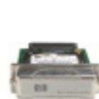
Disco rígido EIO de alto desempenho HP

Permita conectividade sem fio com o servidor de impressão sem fio HP Jetdirect ew2400 802.11b e externo Fast Ethernet conectados via porta USB de alta velocidade.