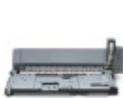
Unid. de impres. autom. em frente e verso

Expanda a capacidade de entrada da impressora HP LaserJet 5200 até um máximo de 850 folhas, instalando a bandeja 3 opcional com 500 folhas (padrão nos modelos 5200tn e 5200dtn).