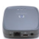
Serv. de impres. externo sem fio HP Jetdirect

Aumente a eficiência e a segurança instalando o servidor interno de impressão HP Jetdirect 635n IPv6/IPsec e Gigabit Ethernet no slot EIO disponível.