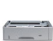
Bandeja de entrada para 500 folhas

Expanda a capacidade de entrada da impressora HP LaserJet 5200 até um máximo de 850 folhas, instalando a bandeja 3 opcional com 500 folhas (padrão nos modelos 5200tn e 5200dtn).