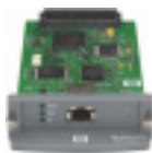
Servidor de impressão interno HP Jetdirect

Imprima documentos profissionais e poupe tempo com a unidade de impressão automática em frente e verso (padrão no modelo 5200dtn).