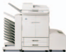
HP Color LaserJet 9500mfp (a cores) com caixa de correio com 8 tabuleiros

Cabo de alimentação, fio telefónico (apenas nos países com suporte de fax), documentação da impressora, CD-ROM com software da impressora, película para o painel de controlo, cartuchos de impressão (4), dois tabuleiros de entrada para 500 folhas, tabuleiro com várias finalidades para 100 folhas, tabuleiro de alta capacidade para 2 000 folhas (Q1891A), impressão frente e verso automática, alimentador automático de documentos, Servidor de Impressão Fast Ethernet HP Jetdirect 620n e disco rígido de 20 GB EIO (E/S Aperfeiçoada) – o dispositivo de saída de papel necessário deve ser escolhido e encomendado em separado.