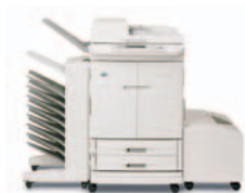
HP Color LaserJet 9500mfp (a cores) com caixa de correio com 8 tabuleiros opcional

Impressão e cópias a cores até A3, digitalização directa p/ correio electrónico, transmissão de faxes 1 , acabamento de documentos e funções de transmissão digital 2 opcionais para grupos de trabalho e departamentos exigentes. As tecnologias avançadas e os consumíveis HP produzem qualidade a cores impressionante e consistente.