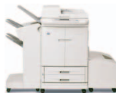
HP Color LaserJet 9500mfp (a cores) com agrafador/empilhador

Proporciona capacidade de empilhamento para até 1 000 folhas, deagrafamento para até 50 folhas de papel por trabalho, de dobração de folhas em conjuntos do estilo de brochuras, para além da produção de folhetos brochados com agrafos de até 10 folhas de papel.