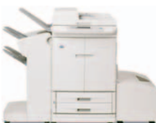
HP Color LaserJet 9500mfp (a cores), com agrafador/empilhador opcional

Ideal para as necessidades gerais de escritório de grande volumes, em departamentos de grandes empresas, onde é necessária uma impressora/fotocopiadora A3 a cores fácil de utilizar, com ferramentas avançadas de processamento de documentos e várias opções de acabamento e de transmissão digital (digital sending) visando uma melhor eficiência e um fluxo de trabalho automatizado.