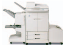
HP Color LaserJet 9500mfp (a cores), com sistema de acabamento multifunções

Empilha até 3 000 folhas de papel com separação de trabalhos em espinha.